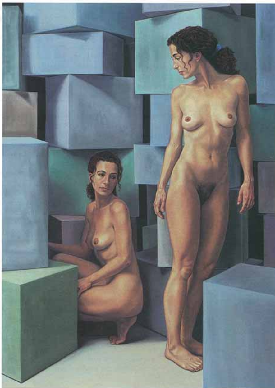
Bilder links aus der Serie „Aus dem Kasten“, 2002, Öl auf Nessel (50 x 40 cm). Rechts: „Passé composé“, 2002, Öl auf Leinwand (160 x 110 cm)

Die Ideen für ihre arbeitsintensiven Kunstwerke kommen der vielbeschäftigten Künstlerin häufig bei ganz monotonen Tätigkeiten, wie Abwaschen oder langen Autofahrten. „In solchen Situationen ist mein Geist frei für die Kunst, und die spontanen Einfälle werden sofort festgehalten. Ich male immer etwas, das für die Zeit passt“, erklärt Christine Reinckens ih-